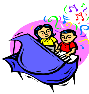
Laps koos õpetajaga

Koolieelse lasteasutuse riiklik õppekava (2008) sõnastab 6-7. aastase lapse eeldatavad üldoskused, mänguoskused, tunnetus- ja õpioskused, sotsiaalsed ja enesekohased oskused.